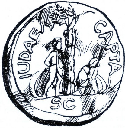
Moneta romana della serie Judaea Capta

Tra le monete tipiche c'è il siclo d'argento (rappresentato qui sopra in alto a sinistra) che porta sul dritto una coppa e le parole in scrittura ebraica "Siclo d'Israele, (anno) 1 o e sul rovescio "Gerusalemme Santa" attorno a tre melagrane.