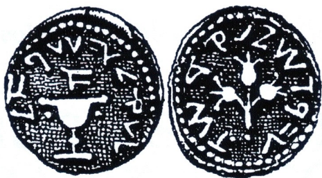
Moneta d'argento della prima rivolta giudaica

Il testo precisa che due spiccioli equivalevano ad 1/4 di soldo.